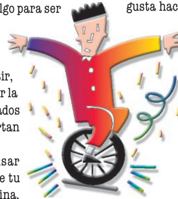
Sin barreras: El significado de la palabra “no” es el mismo en cualquier idioma, sin importar quien o donde se diga.

Pero ¿cómo decidir, exactamente, lo que quieres? Buena pregunta.