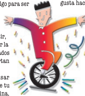
Sin barreras: El significado de la palabra “no” es el mismo en cualquier idioma, sin importar quien o donde se diga.

Pero ¿cómo decidir, exactamente, lo que quieres? Buena pregunta.